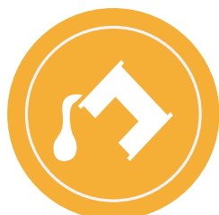
Temperas, plastilinas y/o masas moldeables