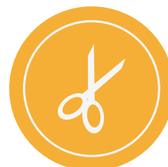
Tijeras y mochilas