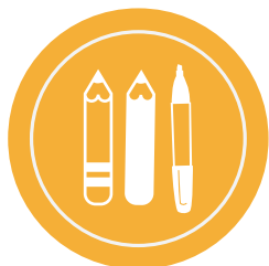
Lápices, cayolas, colores y bicolores